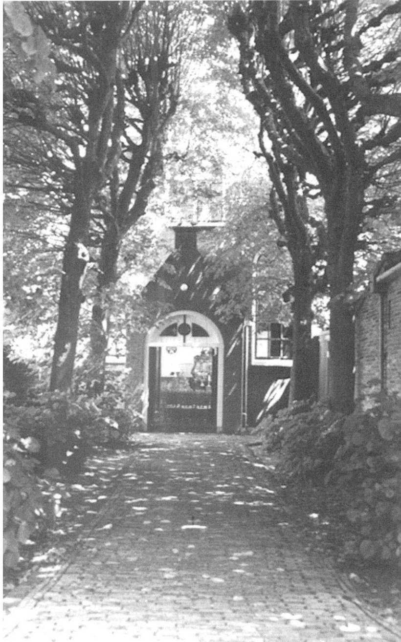
De toenwoordige Lutherse kerk op een zomerse dag.

De Gereformeerden hebben een haantje de Lutherse een zwaantje de Rooms hebben een kruisje en de mennisten een houten huisje.